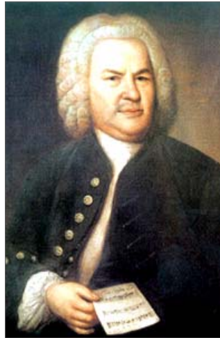
Johann Sebastian Bach 1685 - 1750

Kontaktadressen für schriftliche Anmeldung